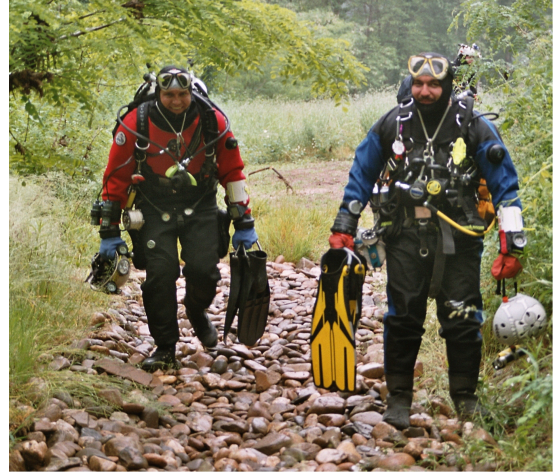
Zwei Höhlintaucher auf dem Weg ....

Allein schon der Gedanke, sich Hunderte von Metern vom Eingang unter Wasser in einem Berg aufhalten zu müssen, löst bei vielen Menschen ein Unbehagen oder gar Angst aus. Wer dann zusätzlich noch unter Klaustrophobie leidet, ist im Bereich Höhlintauchen fehl am Platz und tut weder sich, noch seinen Partnern einen Gefallen.